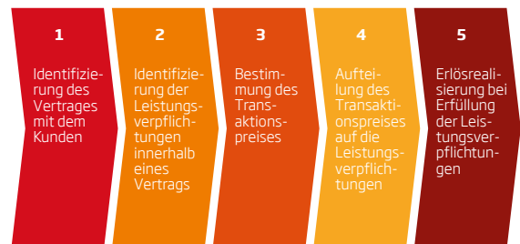
Abb. 1: Die fünf Schritte des IFRS 15 zur Erlösrealisierung